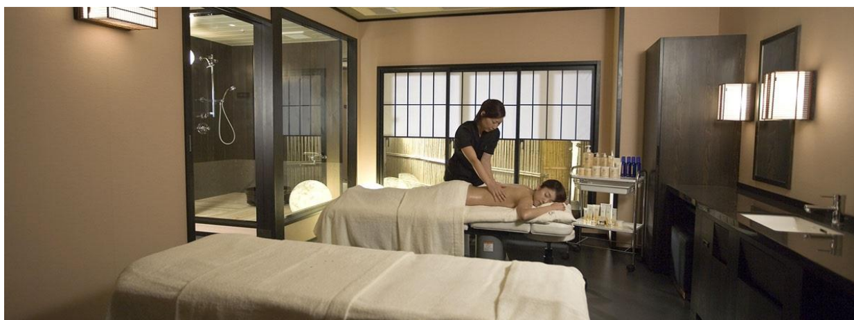
能登の魅力にあふれた『庵 SPA NOTO』