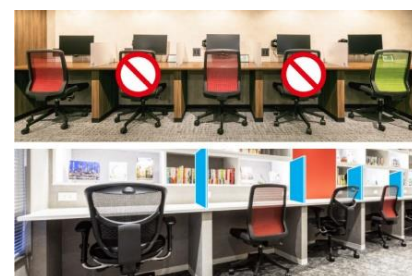
感染症対策 ※画像はイメージ