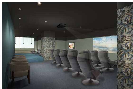
リクライニングチェアでゆったり、リラクゼーションルーム