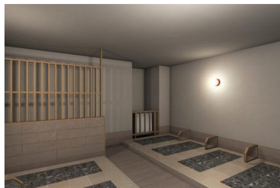
デトックス&amp;リフレッシュできる岩盤浴

当社は、静岡県浜松市、JR 浜松駅・遠鉄新浜松駅から徒歩 5 分の商業施設「ザザシティ浜松」3 階に、温浴施設『かじまちの湯 SPA SOLANI』を 2021 年 2 月にオープンします。地域にも旅行者にも親しみやすく使いやすい施設で地方創生に貢献したいとの思いから、「美と健康のテーマパーク」をコンセプトに、日本で初めてモロッコのハمامをイメージしたロウリュウや岩盤浴など、珍しい温浴施設を充実。1 人でゆったり入れるひのき風呂やシルキー風呂を備えた大浴場、リクライニングチェアで映像を楽しみながらゆったりくつろげるリラクスルームも完備しています。また、国内外で高級ホテルスパを展開する当社のノウハウと、世界中の有名スパプロダクトを集結させたトリートメントルームでは、アジア、ヨーロッパ、ハワイアンなど多種多様な世界中の本格リラクゼーションをご堪能いただけるほか、痩身やネイルなども幅広く取り揃えています。