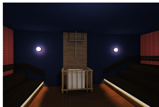
モロッコのハمامをイメージした男女で入れるロウリュウ