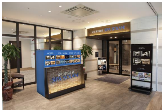
解放感のあるエントランス