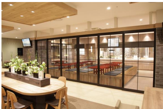
使い勝手のいいワークスペース併設のラウンジ

『かじまちの湯 SPA SOLANI』は、ウェルネスビューティを充実させる一方で、使い勝手のよさも同居できるよう工夫しました。温浴・リラクゼーション以外の設備としては、お好みや用途に応じて選べる宿泊ルーム（個室キャビンタイプ、個室ベッドルーム、4人用ベッドルーム）のほか、インターネットカフェとして使える個室をご用意。また、ワークスペースを兼ねた使い勝手のいい広いラウンジも併設しており、コワーキングや、リフレッシュしながら働くワーケーションにも最適です。