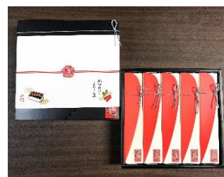
元祖博多めんたい重セット