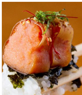
自家製「昆布巻き明太子」