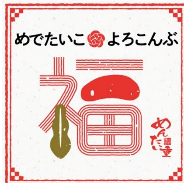
めでたいこ・よろこんぶステッカー