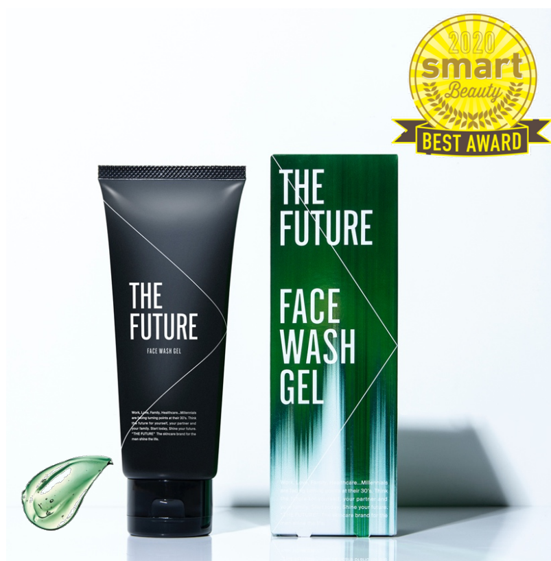
THE FUTURE 洗顔料 150g 1,800 円（税抜）

※2 2020/12/3Amazon 売れ筋ランキング マスキングスプレーカテゴリー