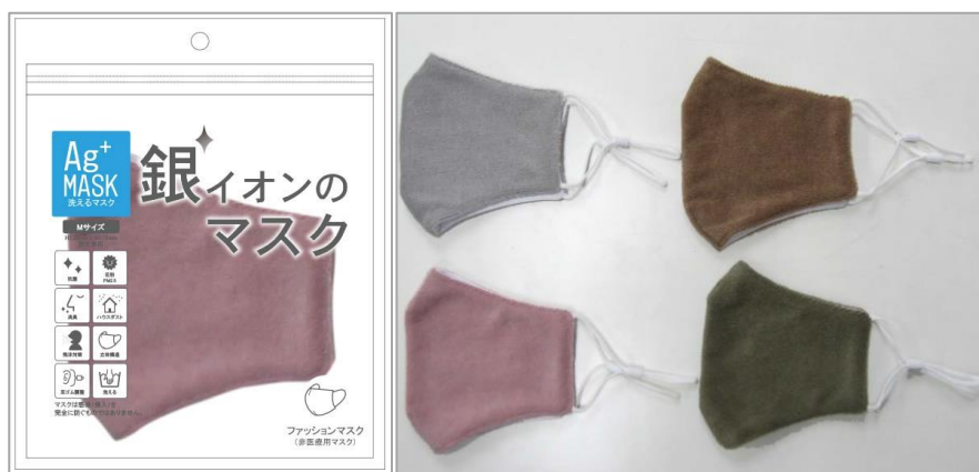
銀イオンファッションマスク(パイル) 【カラー】ピンク・モスグリーン・グレー・ブラウン