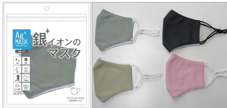
銀イオンファッションマスク(メッシュ) 【カラー】ベージュ・ピンク・グレー・チャコール