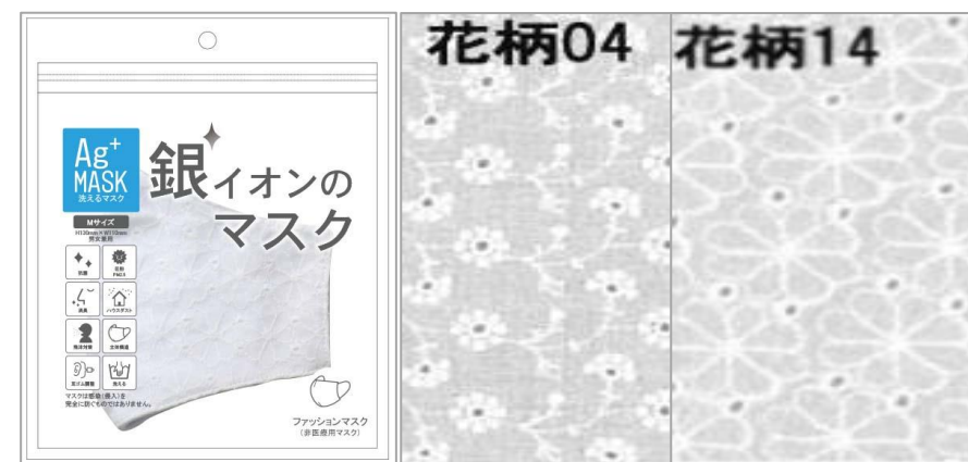
銀イオンファッションマスク(花柄レース) 【カラー】白(04)・オフ(14)

*1 JIS L 1902で規定されている試験方法、菌液吸収法で抗菌効果の程度を判定する指標の値で、抗菌活性値2.0以上(99%以上の減少・死滅率)で抗菌効果があるという規定に対する数値結果。