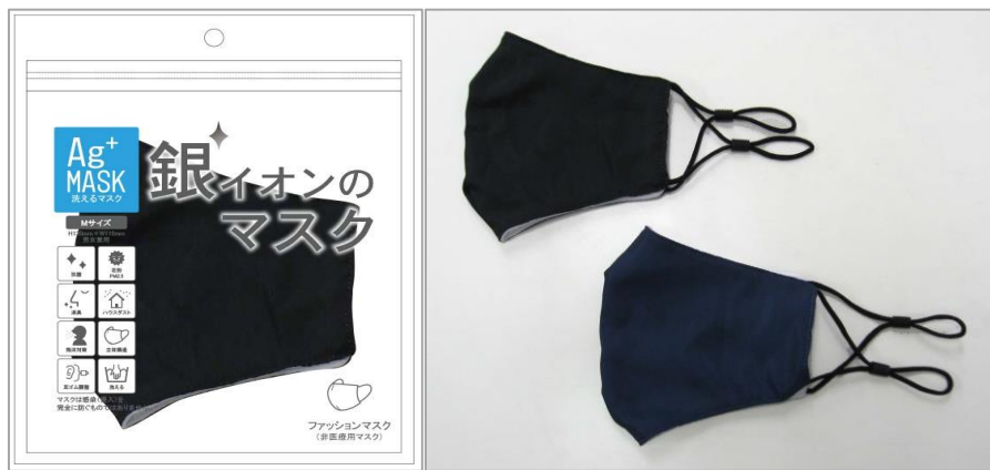
銀イオンファッションマスク(タフタ) 【カラー】ネイビー・ブラック