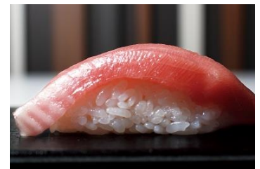
まるでトロのような『愛媛県産 媛スマ』

商品についてのお問い合わせ先：ライドオンエクスプレスお客様相談室 0120-594-096