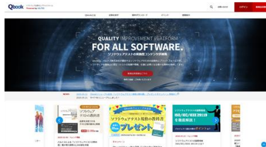
▲品質向上プラットフォーム『Qbook』