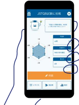
▲資格勉強アプリ『テスト友』