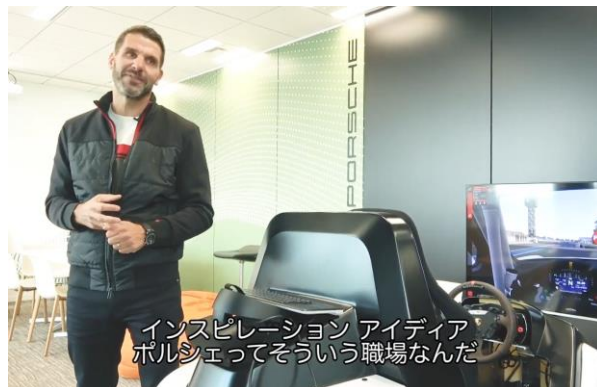
オフィス案内しながら人生でのエピソードを語る

オフィスには社員同士、仲間で気軽に会話ができるラウンジやカーゲーム体験や音楽などを楽しめるイノベーションルームが設けられ、社員を大切な仲間だと想い、社員目線の環境づくりをしているオフィス。幼少期時代からのブレない気持ちが今に表れていることが伝わりました。