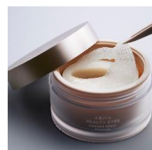
エッセンスシート プレミアム

また、オープン記念として、GINZA SIX 店限定の商品展開のほか、美容エキスパートによる店舗やオンラインでのカウンセリングを予定しております。詳細は決まり次第、改めてご案内致します。