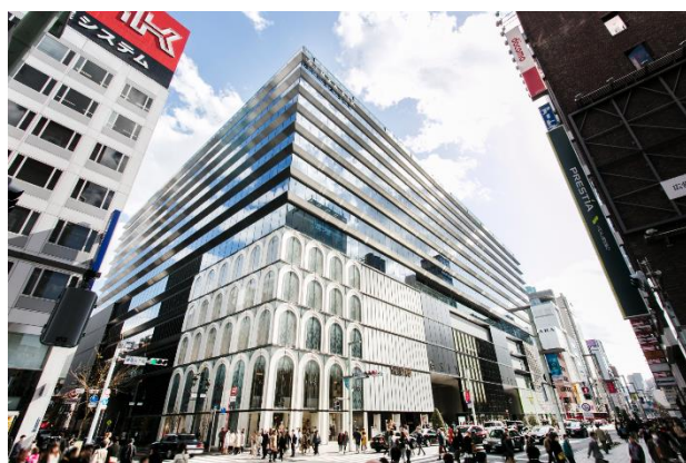
GINZA SIX 外観