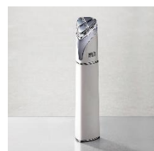
メイト フォーアイズ