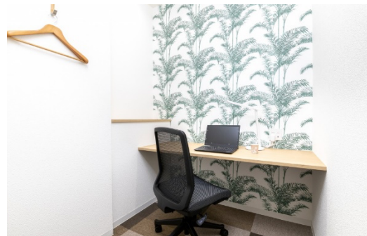
レンタルオフィス（1名用）※イメージ