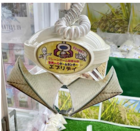
↑爪の画像(農具の箕になっています) ↑景品の酒米の画像