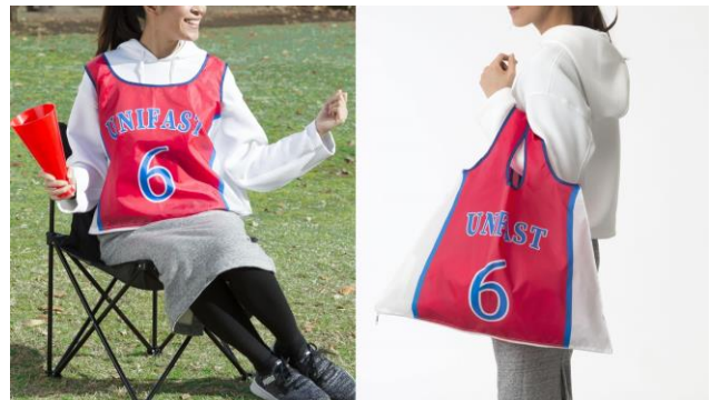
エコバッグがビブスになる『着られるエコバッグ』

（展示会出展アイテム情報： https://www.unifast.co.jp/sportsexpo2021/ ）