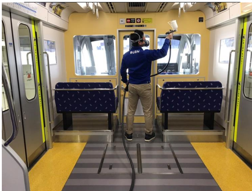
抗ウイルス抗菌コーティング（「レコナ エアリフレッシュ」） ゆいレール車両内の作業の様子