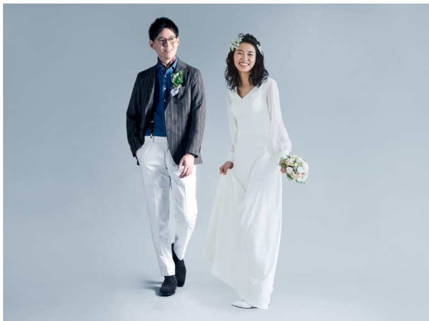
リゾートスタイル イメージ

【PIARY】オーダーウェディングスーツ特設サイト https://www.piary.jp/special/usted_kouahkinn/