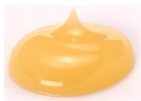
天然「藍」の色 オレンジ

薬用はみがき 「AIPERIO(アイペリオ)」 (内容量：70g) 価格：3,960 円(税込) 医薬部外品