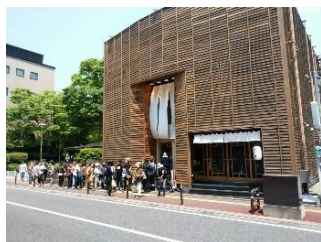
場所：元祖博多めんたい重（福岡市）