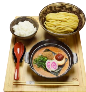
めんたい煮こみつけ麺セット（※イメージ）

コクと旨味のかたまりである自家製明太子を丸1本と10種類以上の野菜をふんだんに使用した「めんたい煮こみつけ麺」。素材の旨みを最大限に引き出すためにじっくりと煮こみ、濃厚なつけだれに仕上げました。もちもちの太麺につぶつぶの明太子が絡み、はじけるように旨みが広がります。