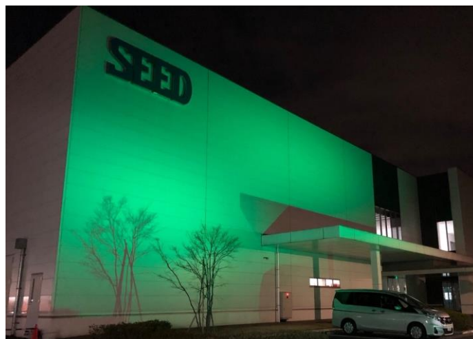
昨年度のライトアップの様子：シード鴻巣研究所 2号棟エントランス前

コンタクトレンズの製造販売を行う株式会社シード（本社：東京都文京区、代表取締役社長：浦壁 昌広、東証 1 部：7743）は、世界緑内障週間である 2021 年 3 月 7 日（日）～3 月 13 日（土）に合わせた「ライトアップ in グリーン運動」に協力するため、シード鴻巣研究所（埼玉県・鴻巣市）を本運動のシンボルカラーである“グリーン”にライトアップいたします。