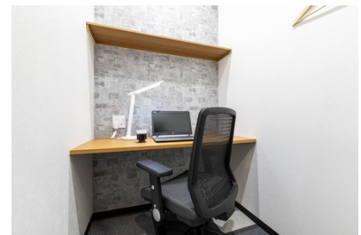
レンタルオフィス（1 名用）※イメージ