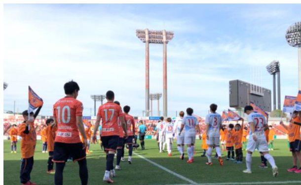
試合当日のイベントの様子