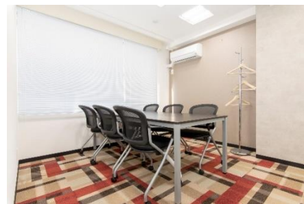
3F 6 名用会議室

食事や通話・WEB 会議のできるカフェブース、会話・通話 NG の静かなサイレントブースと、用途に合わせてブースを分けているので、必要に応じてご利用いただけます。6 名用の会議室もあるので、お客様を招いた打合せや商談、面談などの場所にも困りません。