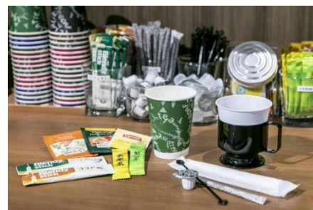
フリードリンク※イメージ

Wi-Fi、各席電源、フリードリンク、プリンターなど、ビジネスに必要な設備を揃えているため、パソコンひとつですぐに仕事ができます。登記やポスト利用のオプションもあるので、費用を抑えたスタートアップにもおすすめです。