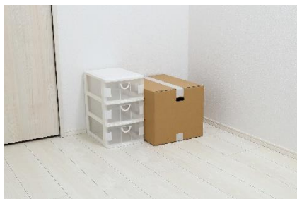
段ボール保管時の仮封かん