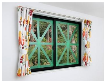
暴風対策によるガラス飛散低減