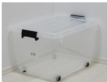
収納ケースの内容表示