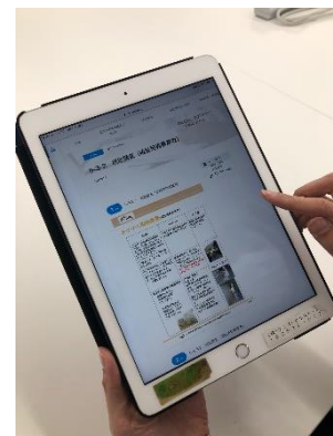
電子マニュアル『ノウハウナビ』

具体的には、現場でぶつかる技術的な質問に関しては、ITを駆使してSVに問い合わせずともスムーズに解決できるよう、電子マニュアルや動画をタブレットやスマートフォンで見て解決できる『ノウハウナビ』をリリース予定です。