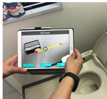
見積アプリ『FUS II』による手すりの設置

当社が自社開発したAIアプリ『FUS II』は、現地調査時にタブレット端末の専用アプリで写真を撮影するだけで、自動的に見積を作成し、クラウド上の管理システムと連携されます。内容に問題がなければ、その場で工事の契約締結が可能となり、施工までの期間を大幅に短縮することができるようになります。今後は、工事代金の決済までワンストップでできるシステム化を図る予定です。