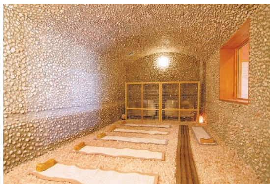
デトックス&リフレッシュできる岩盤浴

当社は、千葉県印西市、北総線「印西牧の原」駅 徒歩1分の商業施設「牧の原MORE」内に、温浴施設『アジアンスパソラニ 牧の原モア温泉』を2021年4月28日にプレオープンします。2020年まで、「リスパ印西」として、地域にも旅行者にも親しまれていた施設をリニューアルいたしました。スパエリアは、テーマ別に11種類の浴槽と7種の岩盤浴&サウナをご用意。趣向を凝らしたお風呂は天然温泉で、豊富に湧出するお湯の泉質は「塩化物強塩温泉」です。特に、慢性の皮膚病・婦人病やきりきず、やけどに効果があります。個室ヴィラエリアは貸切個室サウナや宿泊施設としてリニューアル。また、国内外で高級ホテルSPAを展開している当社のノウハウと、世界中の有名スパプロダクトを集結させたトリートメントルームでは、アジア、ヨーロッパ、ハワイアンなど多種多様な世界中の本格リラクゼーションをご堪能いただけます。