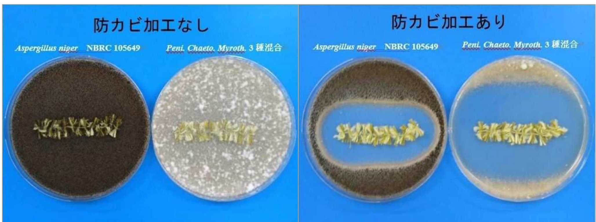
株式会社ワールドインダストリー富山 防カビ試験結果