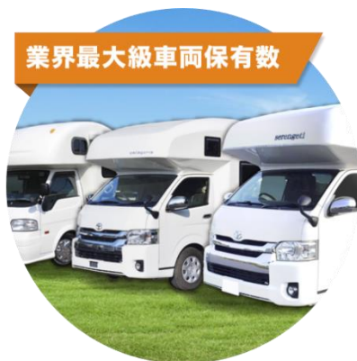
業界最大級車両保有数