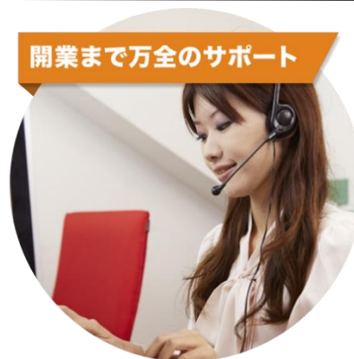
開業まで万全のサポート