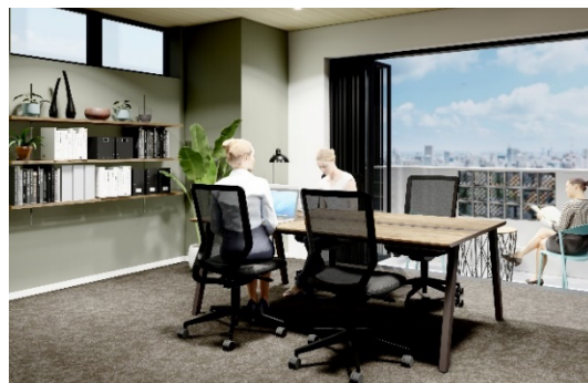
▲ レンタルオフィス（4名用）※イメージ