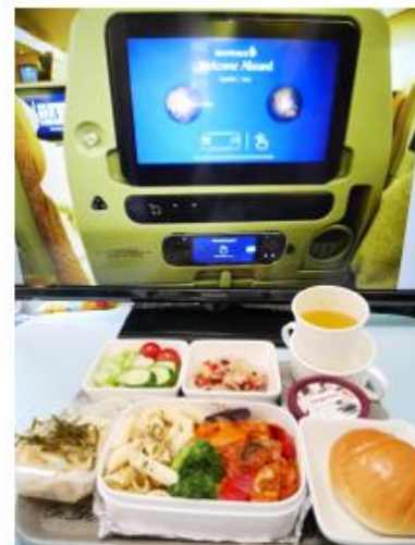
テレビに機内のモニターの写真を投影 お盆の上に四角い容器を用い、おうちで 機内食風を再現

旅工房 Twitter： https://twitter.com/tabikobo