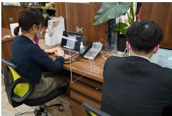
透明度が高く 圧迫感なし