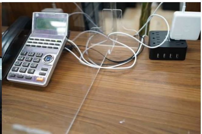
開口部があり 配線しやすい