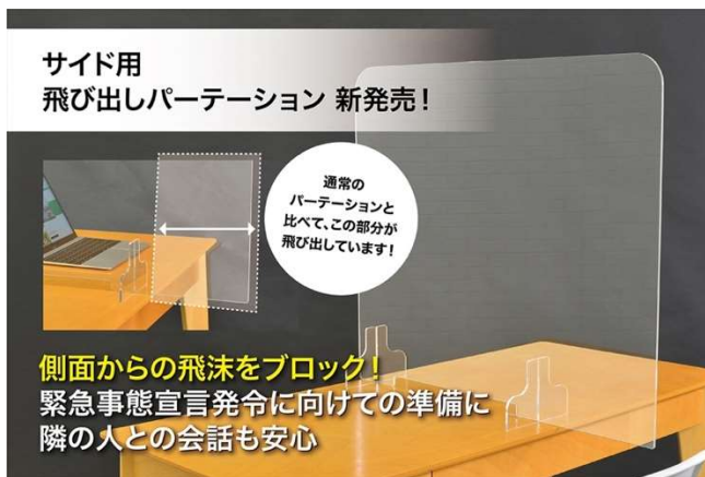
高さがあり、しっかり飛沫防止