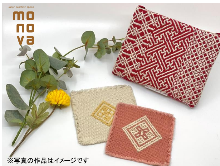
※写真の作品はイメージです

＜オンライン参加OK＞ 東京新宿でこぎん刺しを学ぼう！全3回の体験で2つの作品をお作りいただけます