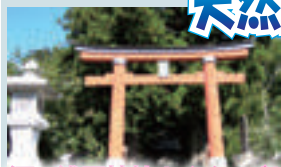
河口浅間神社（イメージ）

1200年以上の七本杉があり、 7本のうち2本並んだ杉は 「縁結びの杉」として人気です。