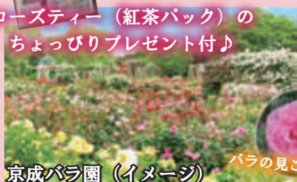
京成バラ園（イメージ）