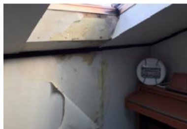
雨漏りで壁が濡れて黒カビが発生