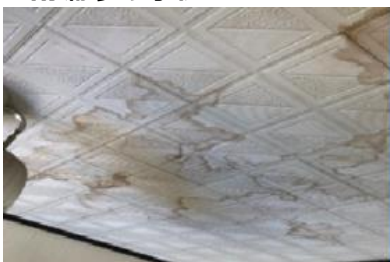
天井からの雨漏り