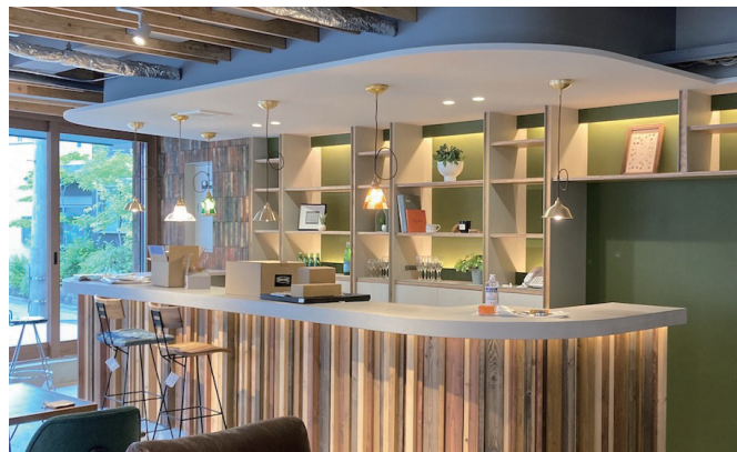
ショールーム内のカフェコーナー