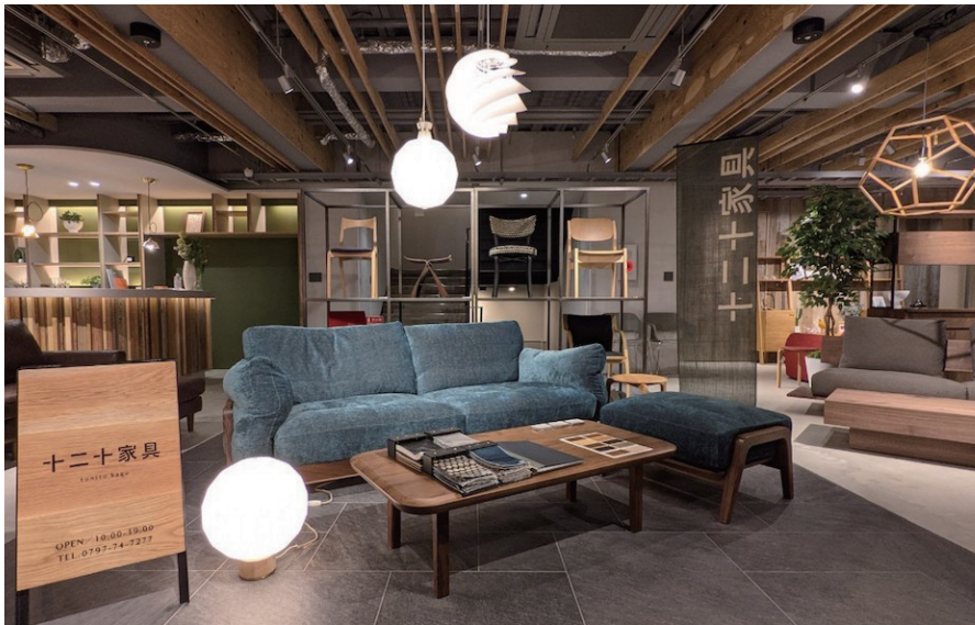
国産品を中心にセレクトした商品約 200 点が並びます

不動産・リフォーム・広告制作・教育事業等を手がける株式会社ウィル(本社:兵庫県宝塚市、代表取締役社長 坂根勝幸)は、家具事業に参入し、ショールーム「十二十家具(とにとかく)」をオープンしますのでお知らせ致します。