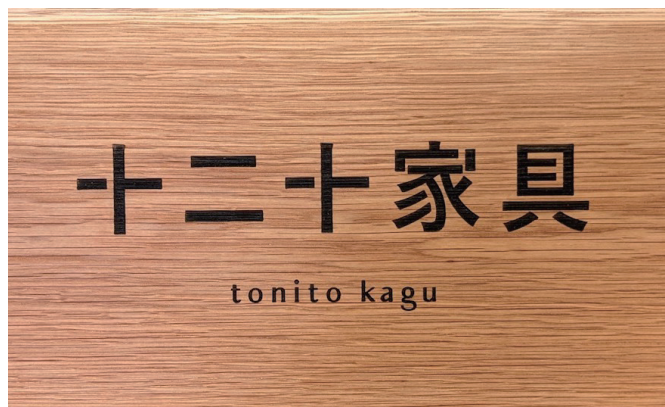
長く使っていただきたいという思いを込めた店名