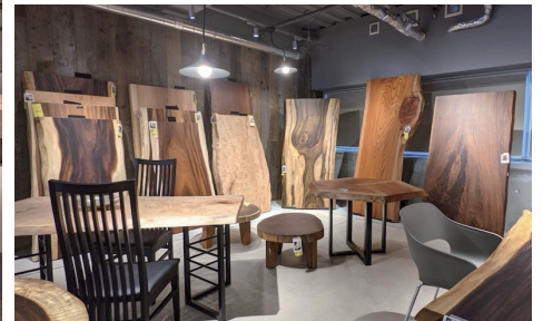
表情が異なる様々な樹種の一枚板も展示