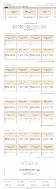
ファイヤーフレーム作成例

今回新規リリースされた<ビルドプラットフォーム>は、管理者が複数のオンラインサロンを包括するプラットフォームを運営するシステムの開発・運用パッケージとなります。