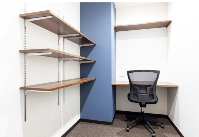
▲ レンタルオフィス (1 名用)