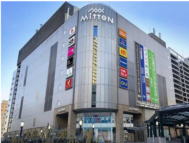
※店舗外観画像はイメージです。

※モニタとWiFiを搭載する除菌液(1次)+UVLED(2次)方式の専用除菌装置(ロック機構付)