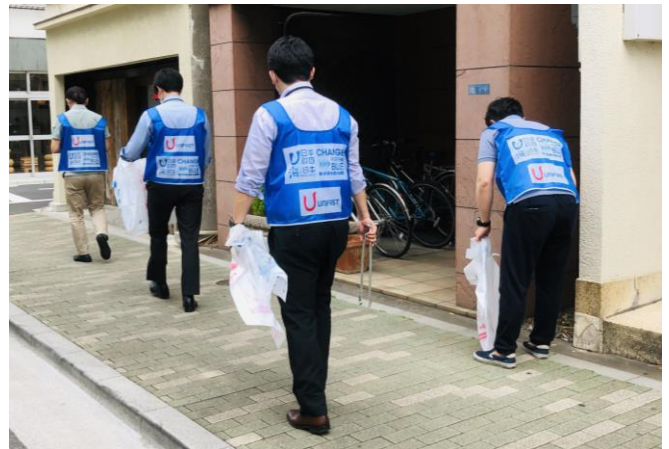
青い「着られるエコバッグ」を着用して、28名の社員が清掃活動を実施

“海ごみゼロウィーク”とは、環境省と日本財団の共同事業で、海洋ごみ問題の周知啓発をおこなう期間です。春は2021年5月30日（ごみゼロの日）から6月5日（環境の日）を経て6月8日（世界海洋デー）まで、秋は9月18日（World Cleanup Day）～9月26日の年2回あり、全国一斉に清掃キャンペーンを開催します。この清掃活動では、参加時に青いアイテム（青Tシャツや青いタオル等）の着用を推奨していることから、当社では環境にやさしい自社開発製品「着られるエコバッグ」の“海ごみゼロウィーク”デザインを製作し、28名の社員が着用して、本社のある東京・浅草橋周辺の清掃活動を実施しました。