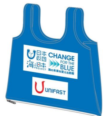
「着られるエコバッグ」の“海ごみゼロウィーク”デザイン

参加した社員からは、「ごみ拾いを通じて環境を守っている実感がわき、気持ちよかったです。日頃から気づいたらごみを拾うようにしたい」「想像以上にタバコの吸い殻が多かった。大人がしっかりしなければと思った」「在宅で家にこもりがちだったので、気持ちよく作業ができた」などの感想が寄せられました。また、近隣の方からは「ありがとう」と声をかけられる場面もあり、地域交流の機会にもつながりました。