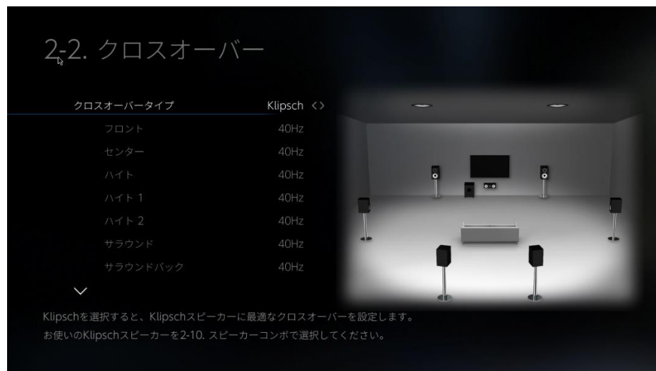
AV レシーバーのクロスオーバー設定の UI 画面

Klipsch Optimized Mode は、今後の当社 AV レシーバー新製品に随時搭載して予定であり、Klipsch の Reference シリーズの新製品が発売されれば、順次アップデートにて追加対応していく予定です。