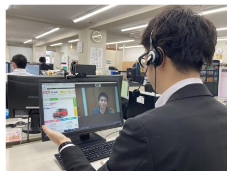
オンライン商談イメージ

当社では、『定額ニコノリパック 中古車』が支持される理由を以下の様に分析しています。