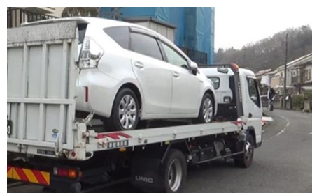
ご自宅まで積載車でお届け