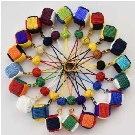
201 か国のキューブ根付

お申し込みお問い合わせは弊社ウェブページ https://www.showen.co.jp/glocolor-cube をご利用ください。