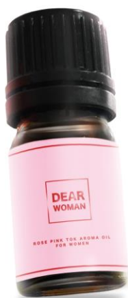
Dear Woman (ローズの香り)