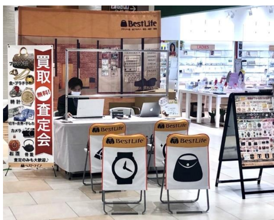
商業施設での買取イベントの様子