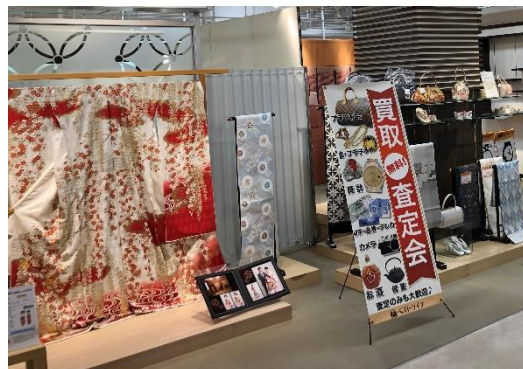
松菱百貨店内の呉服店で買取イベント

当社は今後も、商業施設での買取イベントや他業種とのコラボ出店を積極的に開催し、近隣に店舗がない地域の方でも、安心して査定できる環境を提供することで、これまで捨てられていた資源を活かすことで社会に貢献したいと考えています。