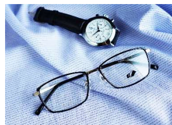
一部、店内フレームの写真です。