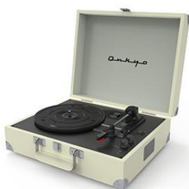
【OCP-01(W)ヴァンテージホワイト】