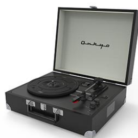
【OCP-01(B)ミスティックブラック】