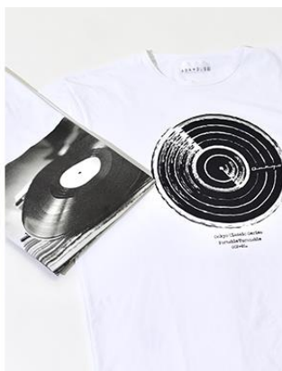
ヴァーサティル T シャツ（アナログ盤）