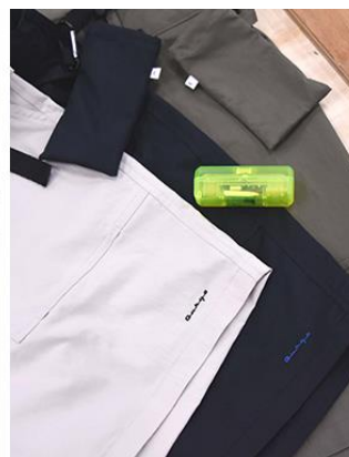
ベイカーショーツ（クラシックロゴ）