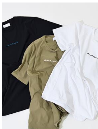
ヴァーサティル T シャツ（クラシックロゴ）