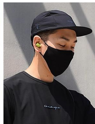
ジェットキャップ（クラシックロゴ）