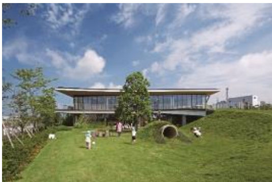
保育・児童施設「ふくろうの森」外観

保育・児童施設「ふくろうの森」は、当社がコンタクトレンズの製造・研究開発拠点である鴻巣研究所の隣接地に、鴻巣市民と当社従業員の「育児と仕事の両立」を支援するために建設し、2018 年 4 月に開園しました。全国的にも珍しい認可保育園、企業主導型保育園、放課後児童クラブを併せ持った、乳児期（0 歳児）から学童期（小学 6 年生）までのお子さんの成長を見守り続けられる保育・児童施設です。「Seed Labo」では、当社社員による実験教室が定期的に行われています。