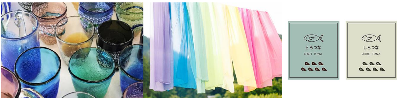
左から（取り扱い商品一例）

日本にはサステナブルに作られてきたモノが多くあります。そういった持続可能性に配慮したモノづくりを知っていただくと共に、そのような商品を購入すること、使うこと自体も、持続可能な未来への貢献の一つになります。