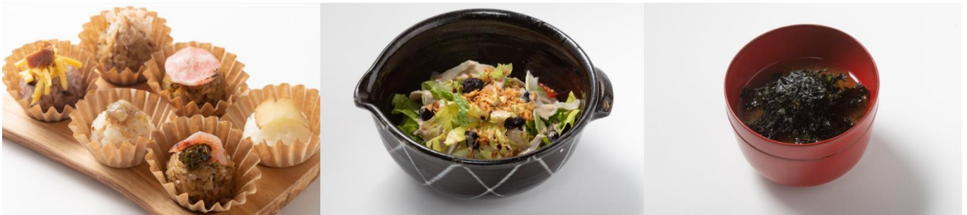
左から（メニュー一例）