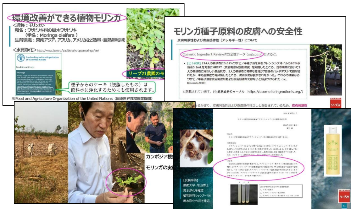
(上画像：提案資料の抜粋)

■リーブ 21 は、発毛施術の一環としてシャンプー施術を提供しています。そこで洗い流した排水に着目した SDGs 活動「水の浄化をシャンプーから取り組みましょう～持続可能な生活資材～」をスタート。最終審査では、生物への負担がない天然植物モリンガによる水質浄化に着目したシャンプーの優位性、市場規模、国連の情報、原料としての安全性、水質浄化のエビデンス、摂南大学・尾山博士との共同研究発表などを詳しく説明。加えて約 15 分間で水質浄化されるデモンストレーション動画（撮影：尾山博士）を紹介。