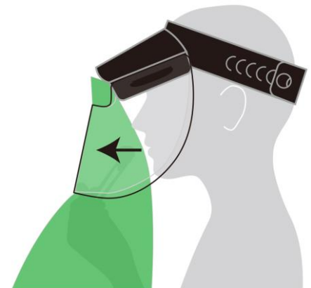
飛沫は上下に拡散するが 前面に飛びにくい