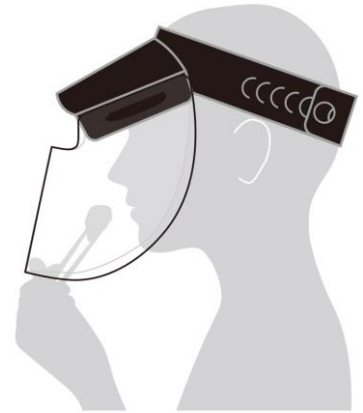
食事をしても 手でマスクに触れない