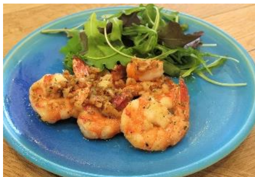
当社オリジナル にんにく 1.5 倍

「食べる“わくわく”を世界中に」をコンセプトに、調味料や乾燥野菜などの加工食品の製造、販売を行う三共食品株式会社（本社：愛知県豊橋市、代表：中村俊之）は、2021 年 7 月 21 日（水）から EC サイト「楽天市場」内の「三共食品 楽天市場店」を中心に、自宅で手軽にハワイ気分を味わえるハワイ発オリジナル調味料「MINATO HAWAII（ミナト ハワイ）」5 種類の販売を開始します。中でも、「MINATO HAWAII」のメイン商品である『ハワイアン スタイル シュリンプ マリネード』は当社限定のオリジナルソースです。（三共食品 楽天市場店 https://www.rakuten.ne.jp/gold/sankyofoods/ ）