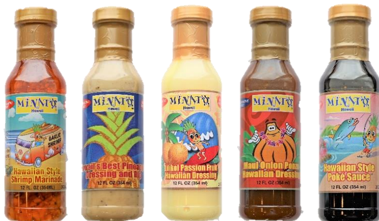
「MINATO HAWAII」全 5 種類ラインナップ