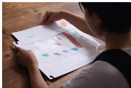
1.絵をポケットフレームに入れる