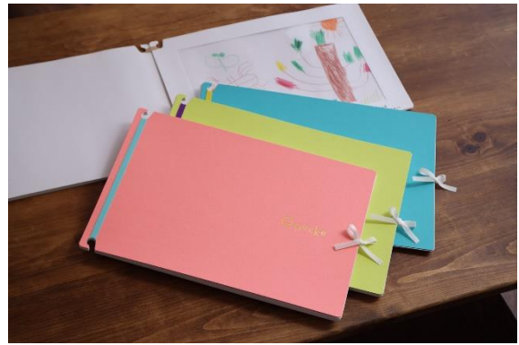
限定色(数量限定各色 50 冊)