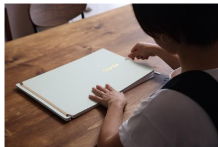
3.ゴムバンドでとじるだけ！