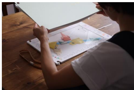
2.好きなところに差し込む