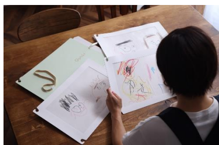
とじるのも入れ替えも簡単